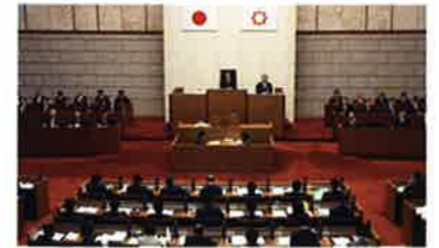
平成28年度予算案を審議する特別委員会

土地交換事業こちらにも吞め さいたま市が進める大宮駅東口の公共施設再編に協力するため、埼玉県大宮合同庁舎敷地とさいたま市大宮区役所別館敷地を交換する事業。平成26年6月定例会で可決したが、自民県議団が推進する埼玉スタジアムへの新駅先行整備を前提とする地下鉄7号線延伸計画などを引っ張り出し、さいたま市議団に強引に同調を求めた。