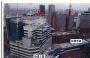
小児医療センター

小児医療センター工事ストップさせる 県立小児医療センターをさいたま新都心へ移転させ新病院を整備する事業。平成26年2月定例会で「瑕疵がある」として、予算案に自民県議団が反対。同年4月臨時会で、再度、再度知事が原案と同額の予算案を提出。自民今度は賛成。3週間、建設がストップした。